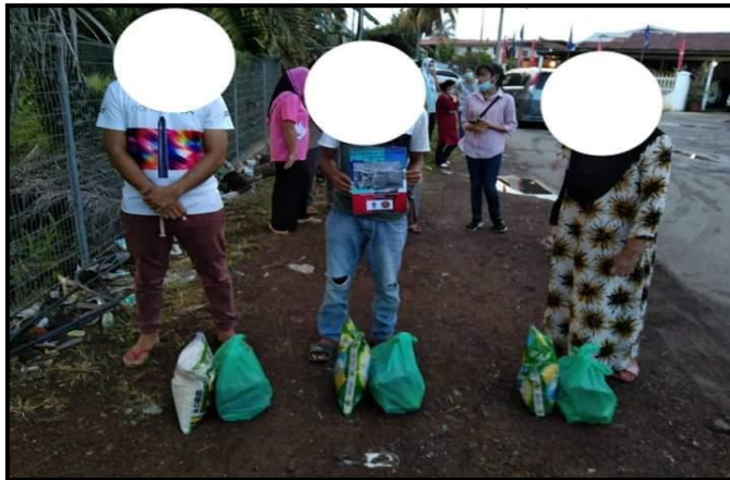
Foto 2: Penerimaan Bantuan Makanan Asas di Pusat Bantuan Dewan Kampung Jaya Baru